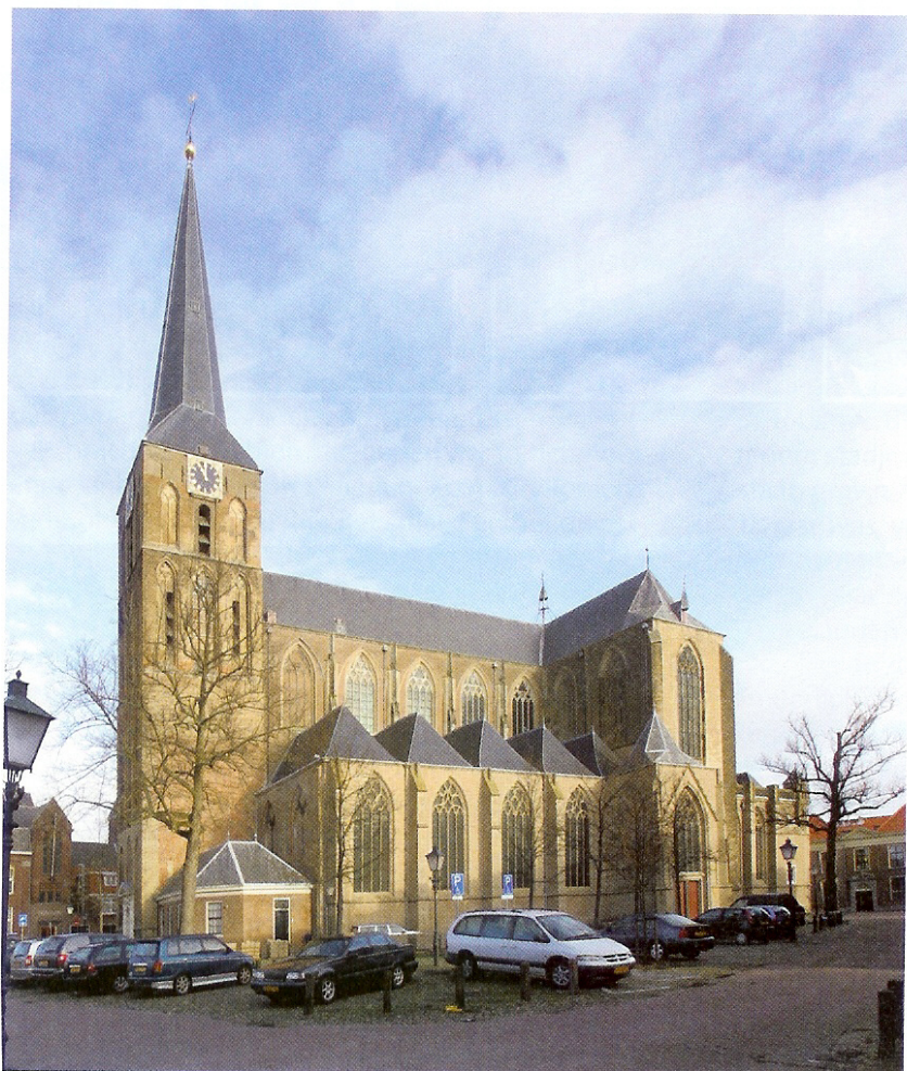
„Een schitterende kerk met een geweldig orgel!”

wen in een goede opkomst en hopen natuurlijk dat de mensen met een ruim hart de collecte zullen gedenken.”